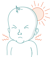
Stel nacke, obehag av starkt ljus