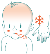
Feber, kalla händer och fötter