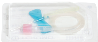
1 injektio-kanyyli/letku-yhdistelmä (perhosneula ja letku)