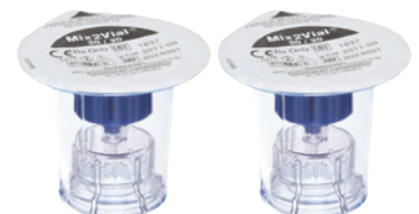
1 tai 2 annosteluvälinettä