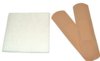
Laastareita ja kuivia sidetaitoksia (eivät sisälly pakkaukseen)