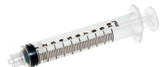
1 kertakäyttöinen 10 ml:n ruisku