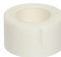
Ihoteippi (ei sisälly pakkaukseen)