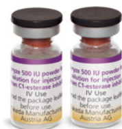
1 tai 2 injektiopulloa käyttövalmiista Cinryze-lääkevalmistetta