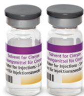
1 tai 2 pulloa vettä injektiota varten (liuotin, 5 ml pullossa)