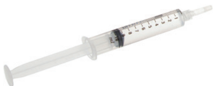
Käyttövalmis Cinryze 10 ml:n ruiskussa, jossa on luer-liitin

Ennen pistämistä pitää saatavilla olla seuraavat tarvikkeet: