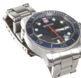
Kello (ei sisälly pakkaukseen)