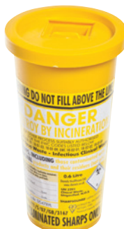
Riskijäteastia (ei sisälly pakkaukseen)