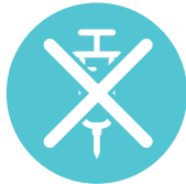
Parenteraalista antikoagulanttihoitoa ei enää anneta