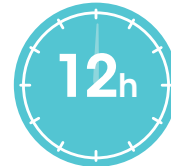
Odota 12 tuntia