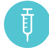
Aloita parenteraalinen antikoagulantti