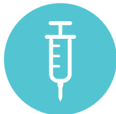
Aiempi parenteraalinen antikoagulantti

Parenteraalinen antikoagulanttihoito pitää lopettaa ja Pradaxa aloittaa 0-2 tuntia ennen kuin aiemman hoidon seuraava aiottu annos olisi ollut määrä ottaa tai yhtäjaksoisen hoidon lopettamisen yhteydessä (esim. laskimoon annettava fraktioimaton hepariini).