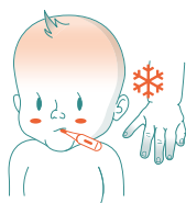
Feber, kalla händer och fötter