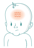
Spänning eller utbuktning på det annars mjuka området på huvudet