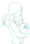
Grinig, ovilja att tas upp eller hållas