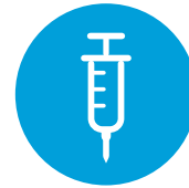
Aiempi parenteraalinen antikoagulantti

Parenteraalinen antikoagulanttihoito pitää lopettaa ja Pradaxa aloittaa 0-2 tuntia ennen kuin aiemman hoidon seuraava aiottu annos olisi ollut määrä ottaa tai yhtäjaksoisen hoidon lopettamisen yhteydessä (esim. laskimoon annettava fraktioimaton hepariini)