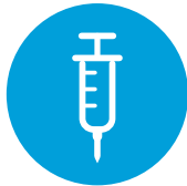
Aloita parenteraalinen antikoagulantti