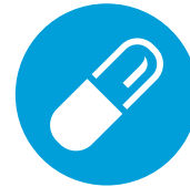
Pradaxa-annostelu aloitetaan 0-2 tuntia ennen kuin hoidon seuraava aiottu annos olisi ollut määrä ottaa