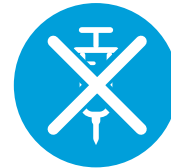
Parenteraalista antikoagulanttihoitoa ei enää anneta