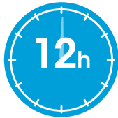
Odota 12 tuntia