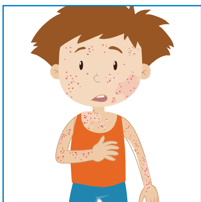
Blek, missfärgad hud, utslag