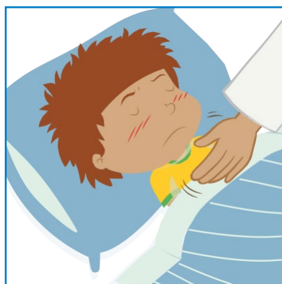
Trötthet, svårt att vakna