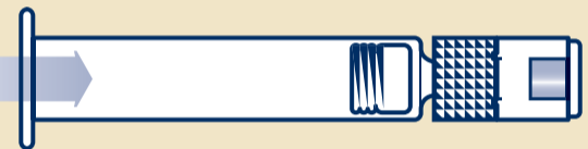
B2 Steriiliä vettä sisältävä esitäytetty ruisku (1)