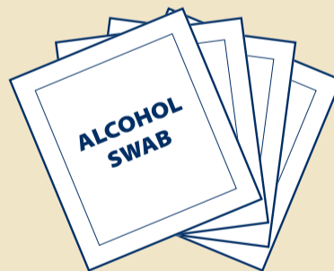
F Desinfiointipyyhkeet pakkauksissaan (4)