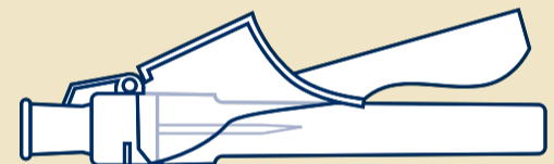
D Turvaneula: 27 G*, 13 mm (1)